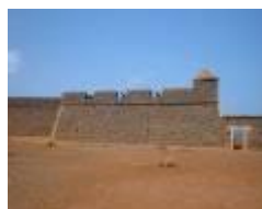
2. Fortaleza de São Filipe - 1587