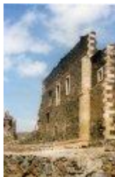
4. Ruínas da Catedral Sé - 1556