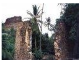
5. Ruínas do Convento de São Francisco – 1640