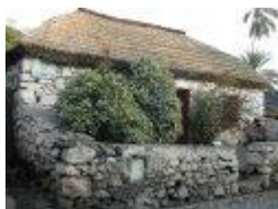
3. Casa Urbana, Rua da Banana – século XV