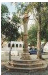
7. Pelourinho – 1512