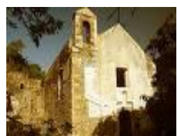
6. Igreja de São Francisco – 1640