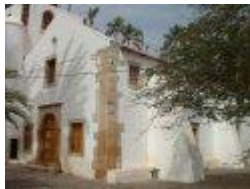
1. Igreja Nossa Senhora do Rosário - 1495