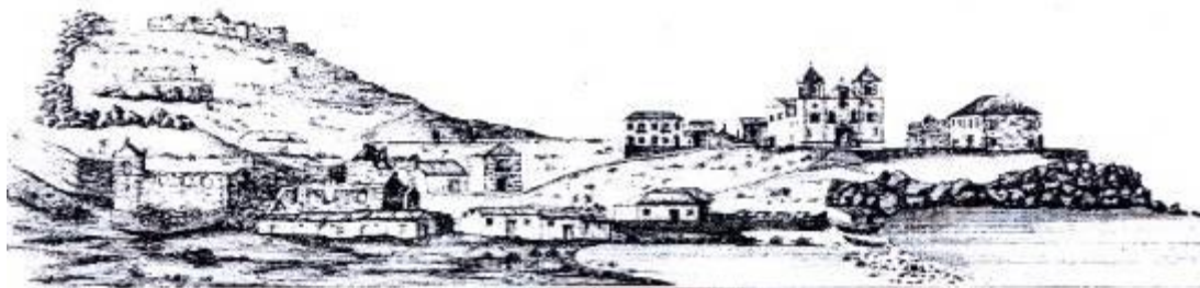
Vista Frontal da Ribeira Grande Século XVI

A Ribeira Grande teve um tempo de vida curto, de 1460 a 1769. Ao observarmos a produção do espaço urbano na Cidade da Ribeira Grande podemos perceber a forma como a arquitetura e o urbanismo marcaram a paisagem. Tais características são herança do modelo formal produzido em Portugal.